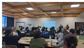
西条ワークショップ講義の様子。

この取組は、地域のみなさんとの研修や現地視察で得た知見を、高校生と一緒に、在住外国人向けワークショップへ反映し、実施を通じて、多文化共生型の防災・減災について学ぶものです。2月には四国4県の関係者との意見交換を経て、今後も地域での開催を支援していくこととなりました。