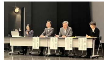
新居浜ESD for SDGsリレートーク。

2月12日、愛媛県新居浜市のあかがねミュージアムで「四国ESDフォーラム2024」を開催。地域をよりよくするための取組が四国各地から大集合しました。四国で最初に地域ESD活動推進拠点となった新居浜市教育委員会で、歴代教育長とともにESDの普及・実践に取り組んできた先生方のリレートークでは、現場での取組紹介を通じて、新居浜市で脈々と続くESD推進の成果を知る機会となりました。ユースの発表では、四国各県から5校が参加。平和やジェンダー、地域の活性化など幅広いテーマが取り上げられ、地域にある学びの多様性や高校生の可能性を感じる時間となりました。