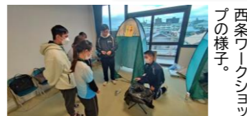
西条ワークショップの様子。