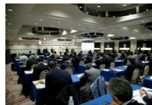
『森里川海プロジェクト・LS四国』企業交流会分科会