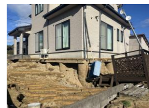
能登半島地震による金沢市内灘町液状化被害状況。

1月1日に発生した能登半島地震について、被害状況が多数報告されました。中でも、液状化による様々な被害が報告され、山地中腹での造成地液状化被害、海岸に近い砂質地盤での液状化被害が発生しています。住宅地盤保証会社では、今回の震災を受けて、今までの地盤判定及び地盤補強工事の対応が適切であったかを検証しています。香川県でも、塩田跡地また内陸部でも液状化の危険性が高い地域が多く存在します。当コンソーシアムでは、南海トラフ地震による液状化被害の減災に務める為、効率的な液状化被害の可能性判定を今後どのように進めるかを、各関係機関と協議を進めています。