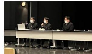
四国のユースESD/SDGs事例発表。